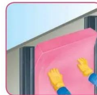
Presione hacia la cavidad.