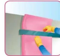
Corte el material excedente con una navaja o cuchillo con filo.